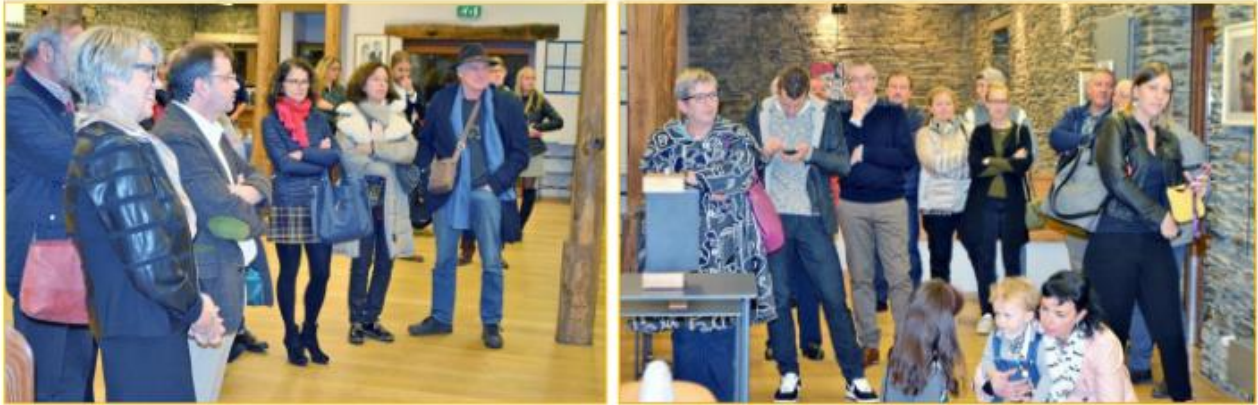
Ein Teil der abendlichen Ausstellungsbesucher

Die Ausstellung in Noertringen ist ihre erste in Luxemburg. Doch schon seit 2015 hatte sie nicht weniger als acht Ausstellungen im katalonischen Barcelona.