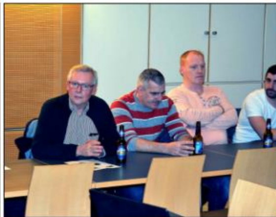
Die Vertreter der Nachbarwehren