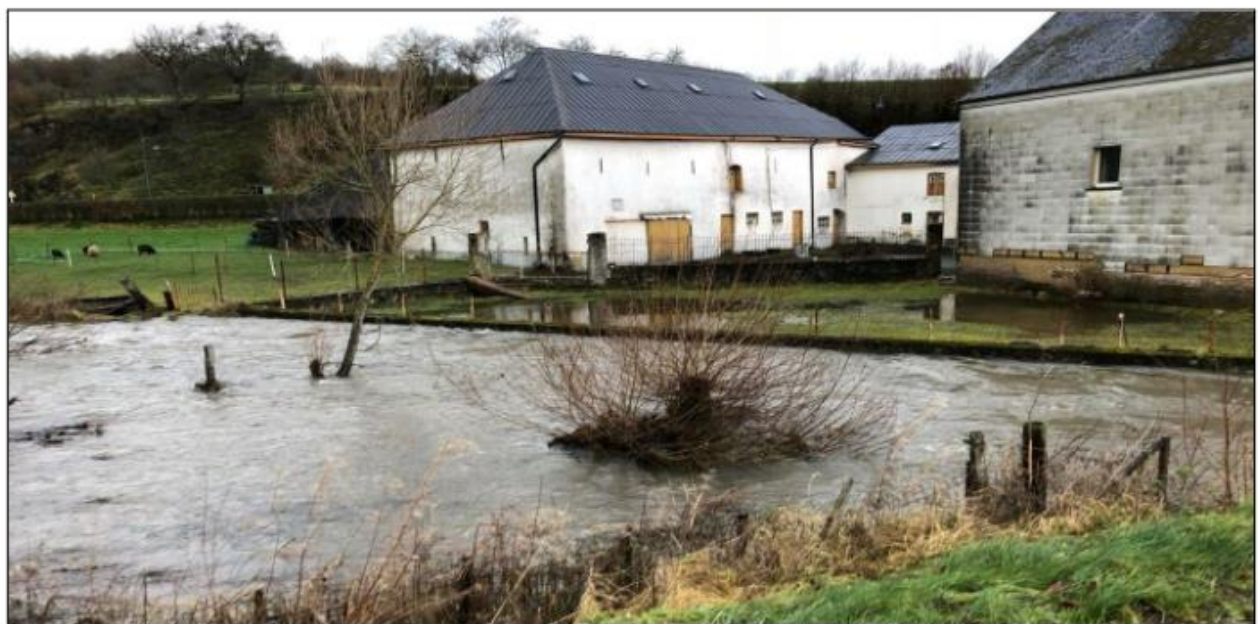
Foto entnommen der Facebook-Seite einer unserer Leserinnen (M.K.) vom Hochwasser bei der Winseler-Mühle

Resultat dieser wochenlangen Regenperioden ist nicht nur der durchnässte Boden. Resultat ist, auch wenn wir hier im Norden nicht so geplagt sind, wie an der Sauer und Mosel, das Hochwasser. Und dies müsste nun wahrlich nicht sein!