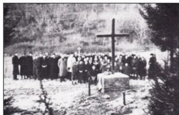
Im Winter 1945-1946 vorzogen der Berler Einwohner ihr Versprechen und errichteten ein Kreuz an der Stelle, wo sie am 4. Januar übernachten sollten.

Unvergessen ist auch seine Rolle als Fürsprecher der Einwohnerschaft gegenüber den deutschen Besatzern. Besonders der Tag des 4. Januar 1945 ist den Menschen im Gedächtnis verblieben, als die gesamte Bevölkerung aus Berlé ihr Heimatdorf, abends um halb sieben, durch den Wald, durch die Dunkelheit, in eisiger Kälte und voller Angst, in Richtung Donkels verlassen musste. Doch in der Tiefe des Tales angelangt wollten sie nach Böven abbiegen, wo die Amerikaner lagen. Doch sie kamen nur bis Altkirch, dort wo