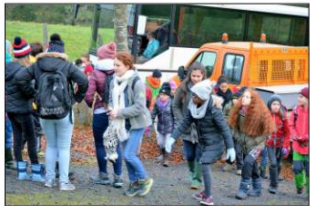
Die Schüler/innen der Regionalschule Obersauer hatten sich in diesem Jahr Soller für das Anpflanzen von Hecken ausgesucht und brachten für einen Tag ungewohntes Leben in den sonst eher stillen und beschaulichen Ort