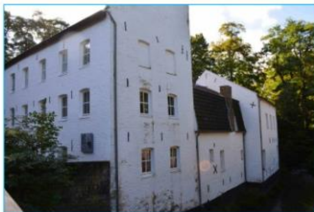
Das Geburtshaus des Musikers und Orchesterchefs André Rieu