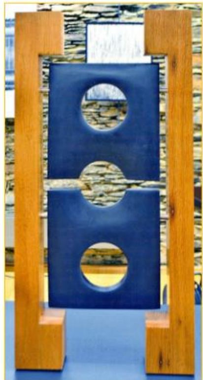
Text und Fotos: Jos Emeringer