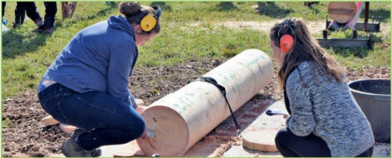
Während die einen arbeiten, amüsieren sich die anderen gar fürstlich: