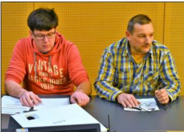
Die beiden Kommandanten

Den Versammlungsdiskussionen war ebenfalls zu entnehmen, dass beide Wehren in Zukunft ihre Aktionen, von Übungen bis hin zu Einsätzen, gemeinsam angehen. Und dies ist kein schlechter Beginn für einen gemeinsamen Neuanfang.