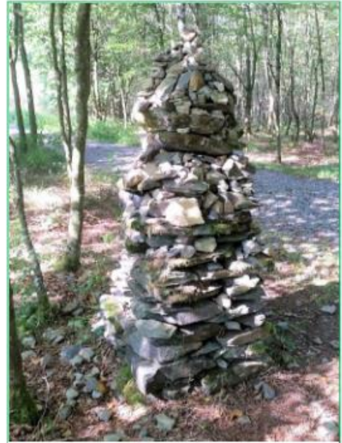
De "Rock Cairn"

ech dës « Rock Cairn » just aus dem Tibet voam Fernseh her kannt hoan. Anscheinend ginn et däre ewer e bëssen iwverall op der Welt. Dem Brauch no soll all Passant och rëm ee Steen dropleeë, fir de Geester merci ze soën, datt e seng Reess heel iwverstannen hoat. A Kalifornien sënn dës Kéip Steng op 10.000 Joër datéiert ginn. Ech war frou, datt de Koup no mengem Steen nach do stung !