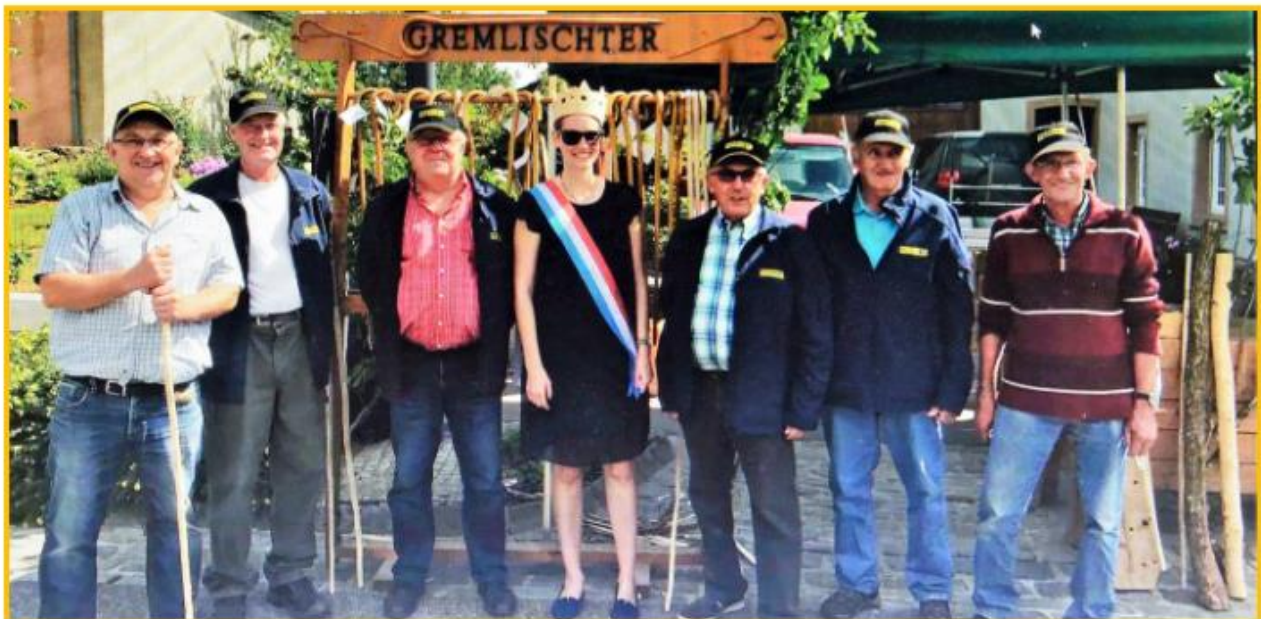
Die Gremmleschter Bengeln mit der Bëschkinnigin 2017