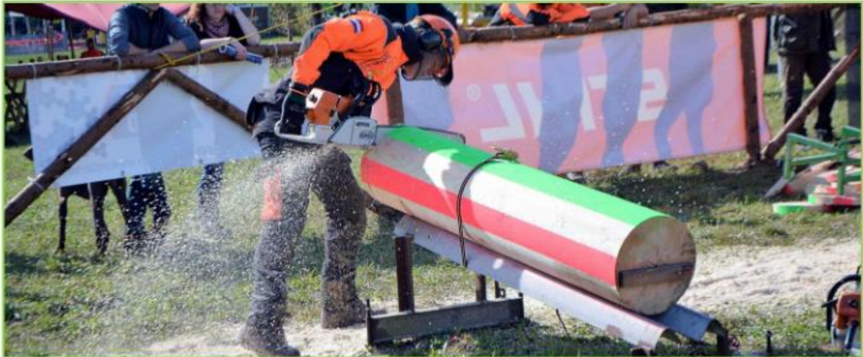
↑ Feinarbeit ist beim Wettbewerb angesagt ↓