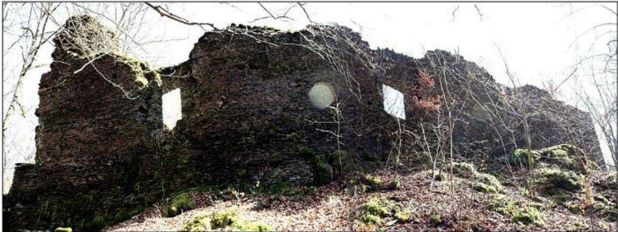
Ruine des Schlosses Schorels (Schuerels) in der Nähe von Heispelt

Mit der Schieferburg ist ohne Zweifel des Schloss „Schorels“, in der Nähe von Heispelt, gemeint.