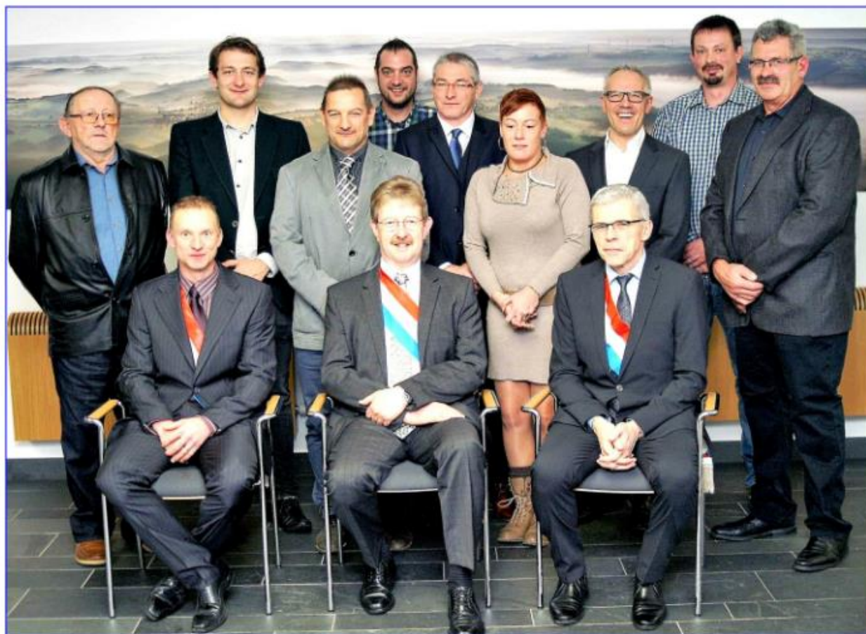
Der neue Gemeinderat zusammen mit den Gemeindebeamten