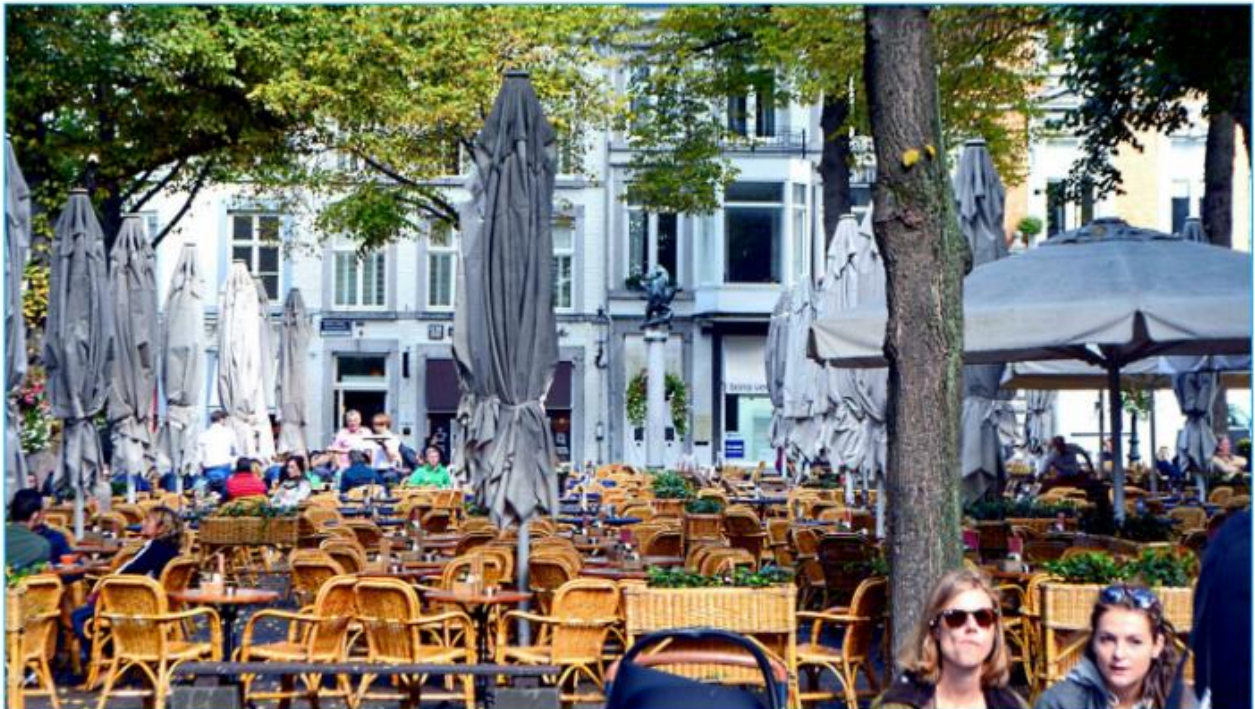
Einer der gemütlichen Aufenthalte in Maastricht. Hier an der Basiliek van Onze Lieve Vrouwe

Den Henri de Blannen ass 1196, am Alter vun 82 Joer gestuerwen. Seng eenzeg Duechter, d'Ermesinde, war deemols réischt 10 Joer aal. Am Jor 1214, dräi Méint no dem Doud vu sengem éischte Mann huet sie sech fir d'zweet mamm Walram vu Limbuerg bestued, dee Widdman war a Kanner hat. Esou entsteet eng Union Personeller zwëschen der Grofschaft vu Lëtzebuerg an dem Duché vu Limburg. Den Henri le Blondel, Jong vum Ermesinde an dem Walram, war den éischte Pränz, deen d'Wopen gedroenhiet dat dono d'Nationalwopen vu Lëtzebuerg sollt gin. (familiär Gemeinsamkeet).“ (1)