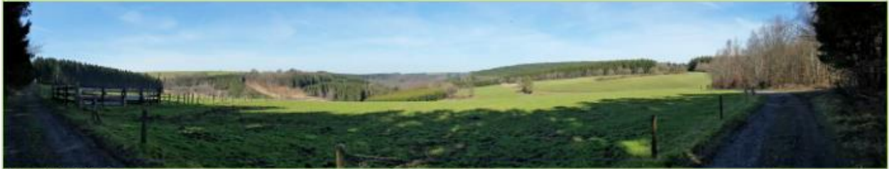
Peesch bei Bonnerue

Déi allerbeste Schwéiermamm hoat mech moies géint 10 Auer zu Houffalize oafgesat, do wou ech d'letz Joer am Summer mat der 3. Etapp opgehal hat. Den Auto blouf fir de Retour zu La Roche stoen.