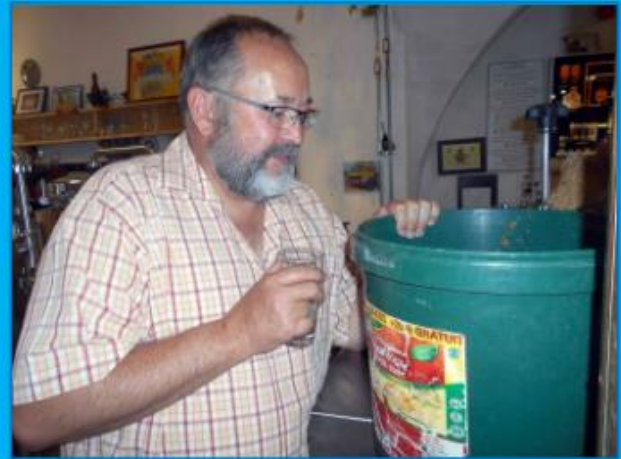
Von wo er sein Bier wohl hernahm ... ?