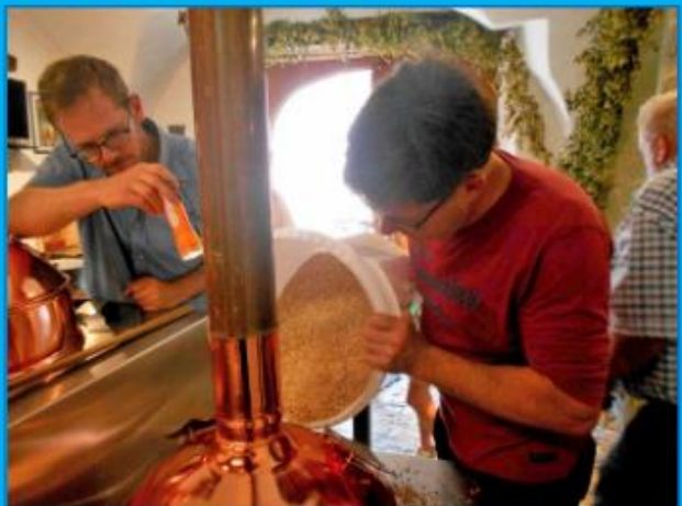
Sie waren verantwortlich für die Würze ...