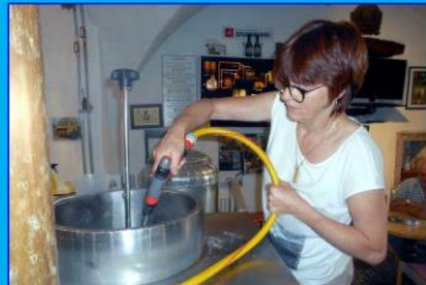
und ... unsere 'Fleur Cathy' beim Spülen (Bericht und Bilder ifem)