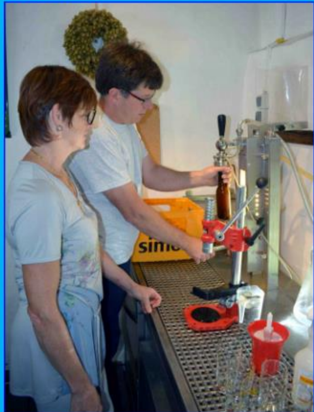
Unsere manuellen Abfüllmaschinen (?)