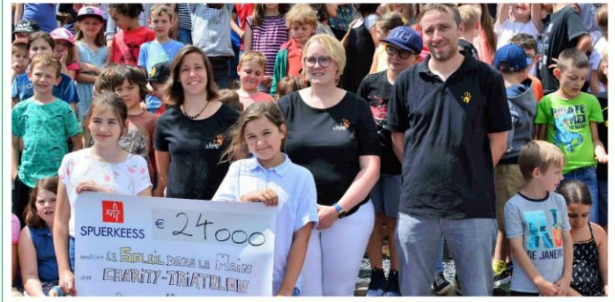
Fotoen op dëser Säit: 9. Juli 2018