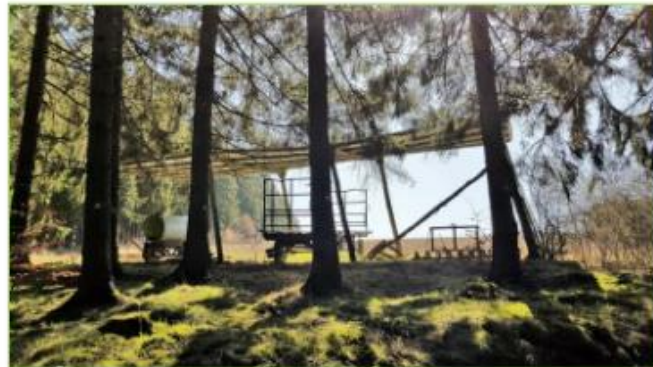
Al Zäitzeien aus der Landwirtschaft bei Buret