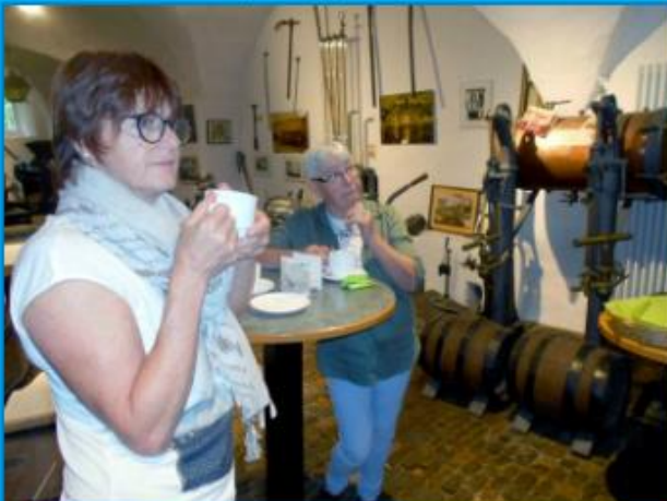
Kaffeepause beim Bierbrauen