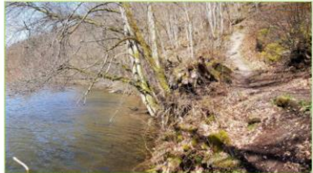
Wee laanscht d'Ourthe

Neeft der Bréck, iwwert déi d'Strooss voan Nisramont rop op Nadrin verleeft, gung de Wee rem laanst d'Waasser. De Kayak gëtt hei voa villen Touriste benotzt, fir d'Natur « méi fléissend » z'erleewen. Och deen Dag koumen der Zweek mat hirer Plastikbiedchen roafgefoahr a ware richtig begeistert voan hirer Aventure. Dat probéieren ech ewer och eng Kéier, doacht ech, da brauch ech wéinstens de Rucksak nik ze schleefen !