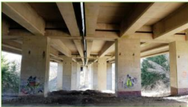
Viaduc de Houffalize

Au 17 e et 18 e siècle, l'industrie liégeoise florissait et manifestait une forte demande en écorce et charbon de bois. Les forêts ardennaises en ont terriblement souffert. A partir de ce 17 e siècle, les surfaces non utilisés ont dû être soit cultivés, soit reboisés. C'est ainsi que l'épicéa est devenu l'arbre principal de nos forêts.