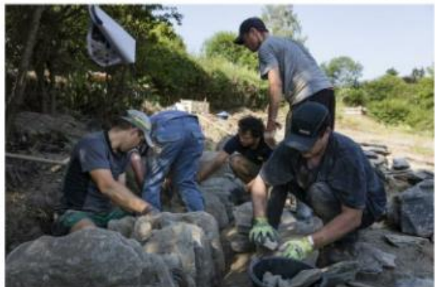
Vorige Seite Bild 1) und 2): Die fertige Trockenmauer. Diese Seite: Die ‚Mauerkünstler‘ und ihre Helfer bei der schweisstreibenden Arbeit. - Unten: So sind die einzelnen Steine auf- und ineinander geschichtet.