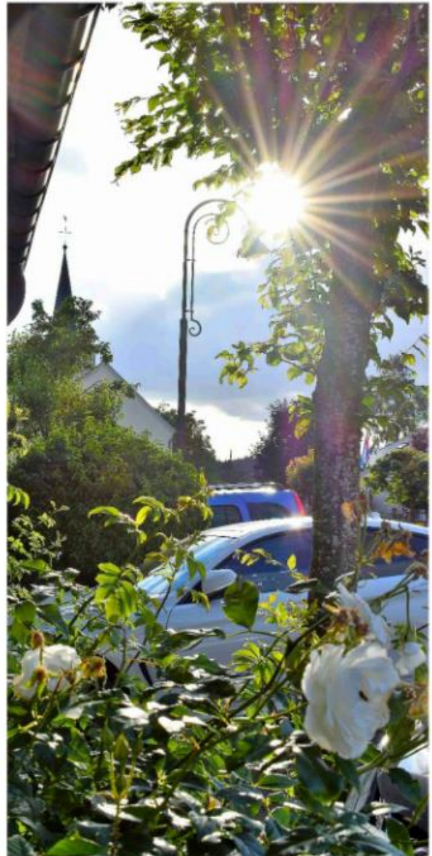
Nationale Feierdag 2018