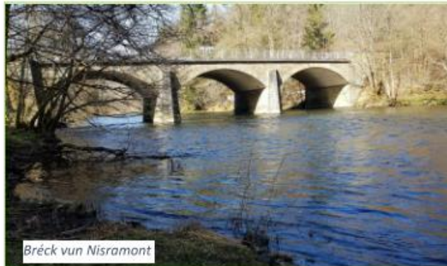
Bréck vun Nisramont

Après le pont de Nisramont, j'ai longé l'eau avant d'atteindre la dernière montée vers Ollomont puis Nadrin qui représentait la destination finale de ma 4 e étape. Un couple d'aventuriers m'ont fait signe dans leur kayak avant de continuer leur voyage en aval. Quelle élégante façon de voyager me suis-je dis. En plus, pas besoin de porter de sac à dos. Ce dernier commençait à se faire remarquer sérieusement sur mes épaules.