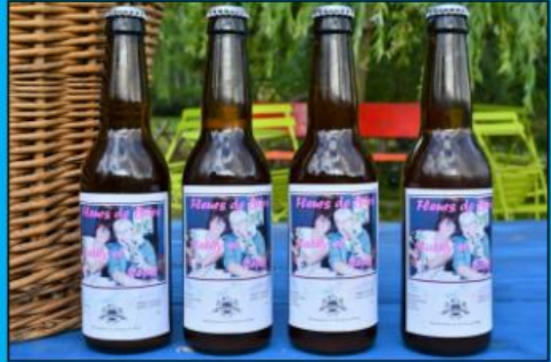
Die fertigen Flaschen