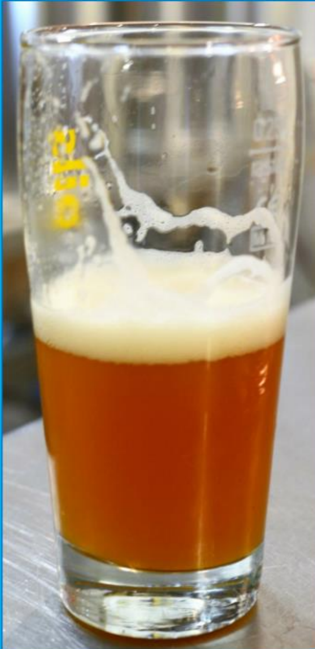
Das erste Bier im Glas ...