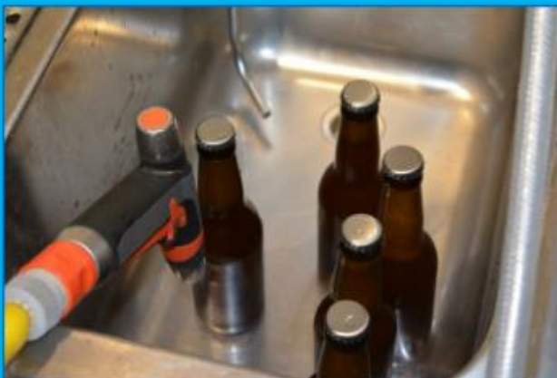
... und in den Flaschen