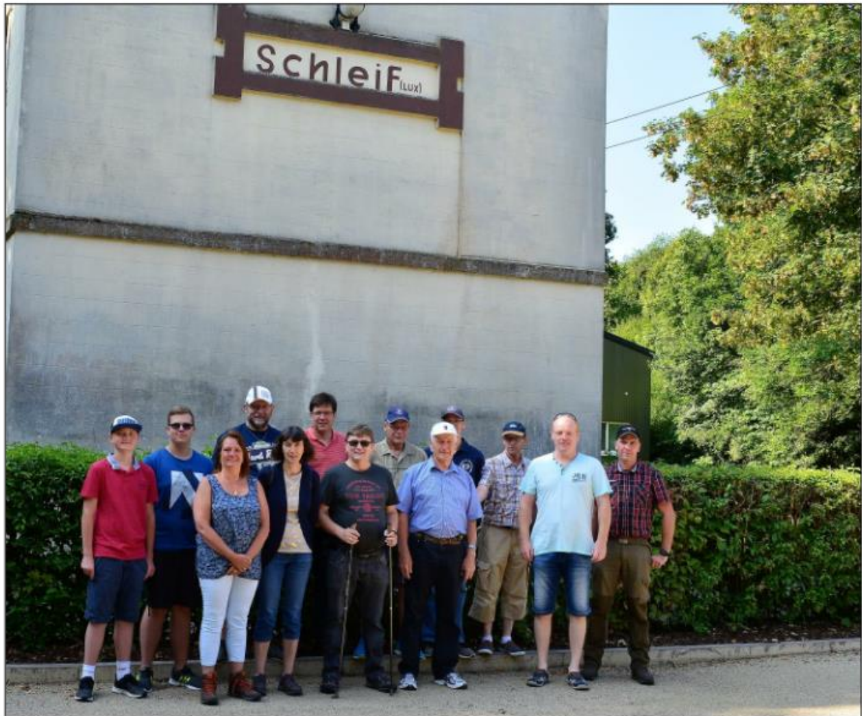
Si si gären opgestane: Motosfuerer, Spadséiergänger a Petanquespiller

Leider konnt de Fotograf vun der Hobitz net fir d' Mëttegiessen bleiwen an huet dee battere Wee op eng privat Feier missten untrieden. Hie konnt och nëmme eng eenzeg Foto schéissen, an dat war schonn esou fréi, dat d'Actricen an d'Acteure nach guer net alleguer an der Schleef agetraff waren.